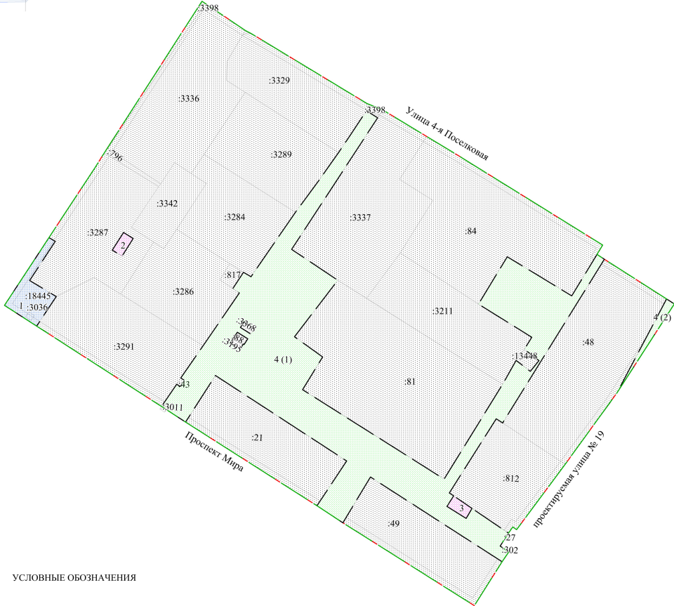
Схема расположения грани проектирования и элементов планировочной структуры проекта планировки территории городка Нефтяников, расположенной в границах: правый берег реки Иртыш – улица Заозерная – улица Комбинатская – улица Химиков – улица Энтузиастов – переулок 1-й Окружной – переулок 2-й Окружной – улица Доковская – проспект Мира – северо-восточная граница отвода «Сибэкстрострой», АТП-10, ГСК «Асфальт» – в Советском административном округе города Омска

Приложение № 1 к постановлению Администрации города Омска от _____ № _____